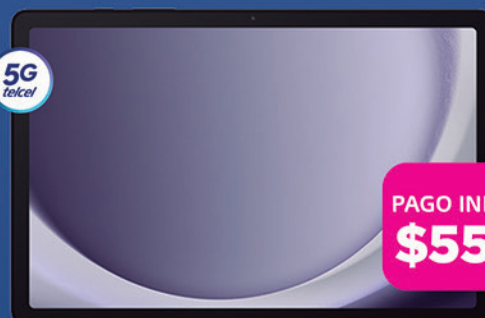
SAMSUNG Galaxy Tab A9+