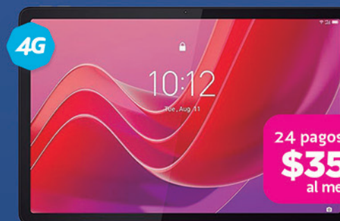
LENOVO Tab M11 + Case de regalo