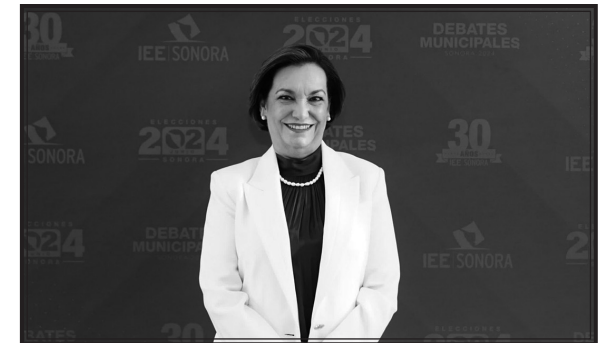
María Dolores del Río

Y DE ESTAMPIDAS... Vaya que estarán la mar de interesantes estas elecciones del 2027, porque por primera vez será como el béisbol o fútbol americano, pues estará lleno de agentes libres que cambiaron de equipo. Haciendo un balance es difícil encontrar a un político que se mantenga