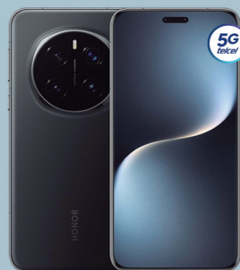
HONOR magic 7 pro 512GB