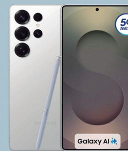
SAMSUNG S25 ultra 512 GB