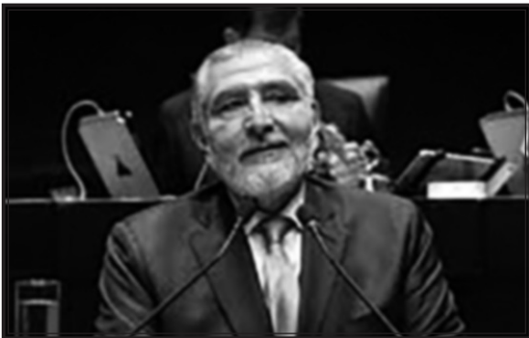
Adán Augusto López