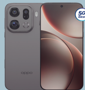
OPPO Find X9 Pro