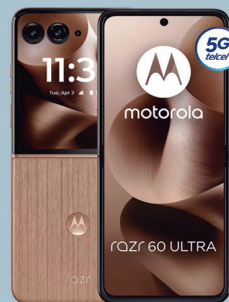
MOTOROLA razr 60 ultra