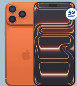
APPLE iPhone 17 Pro Max 512GB